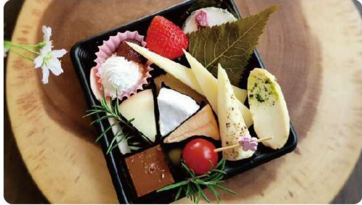
各工房のおすすめチーズの詰め合わせ ※数量限定