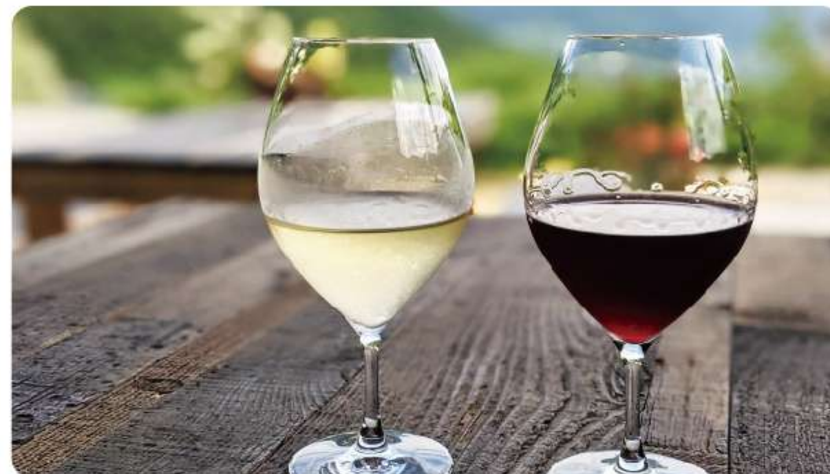
那須塩原産ワイン / セラヴィ (ソムリエ) セレクトワイン / ノンアルコール / 野菜やパン / 加工品等