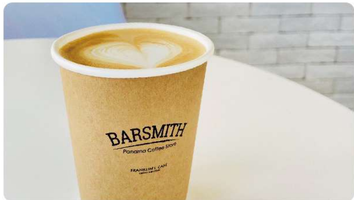
バナマトラディショナル / バナマグイシャ