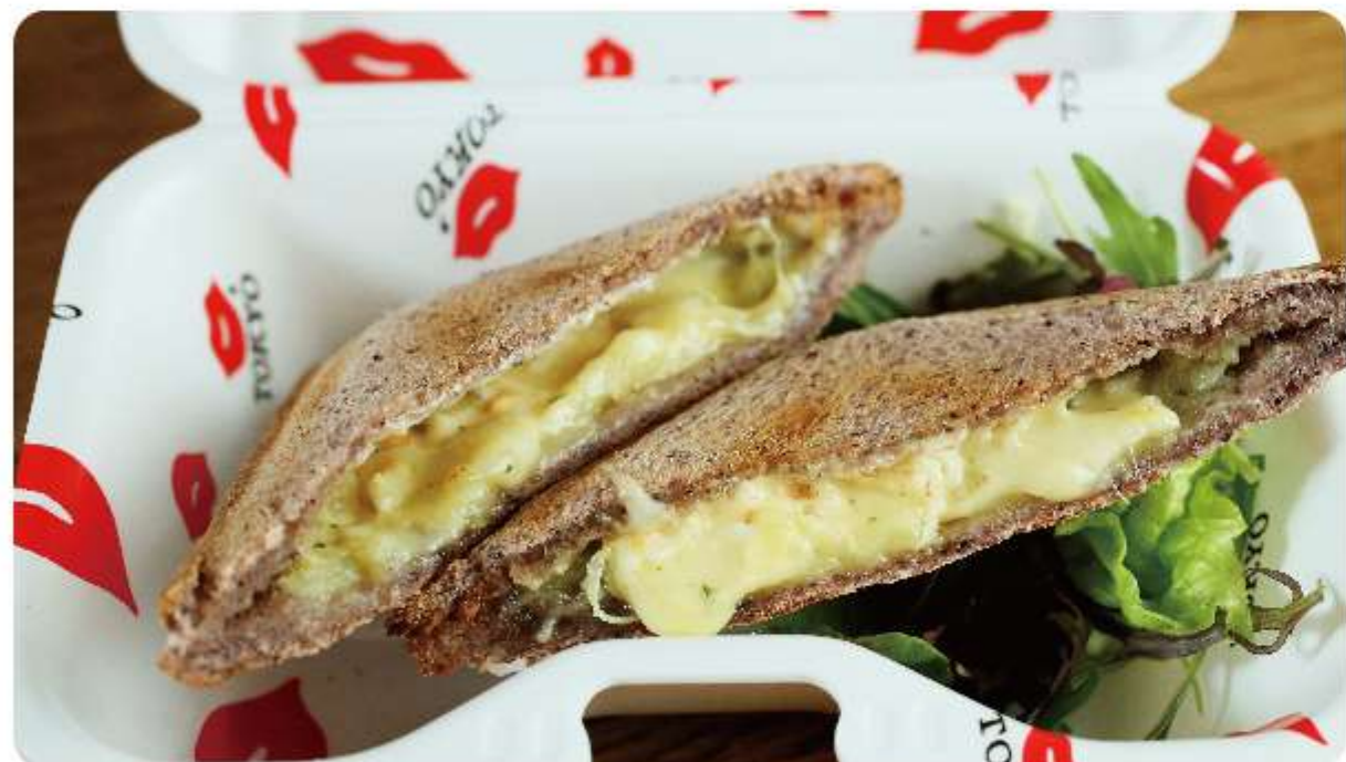
※チーズと牛肉の串焼き数量限定