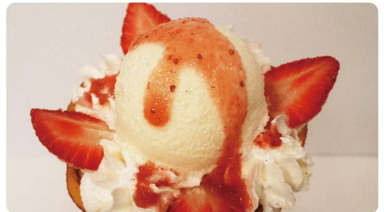
いちごスムージー / スカイベリーレアチーズジェラート / レアチーズいちごクレープ / アイスコーヒーフロート 他