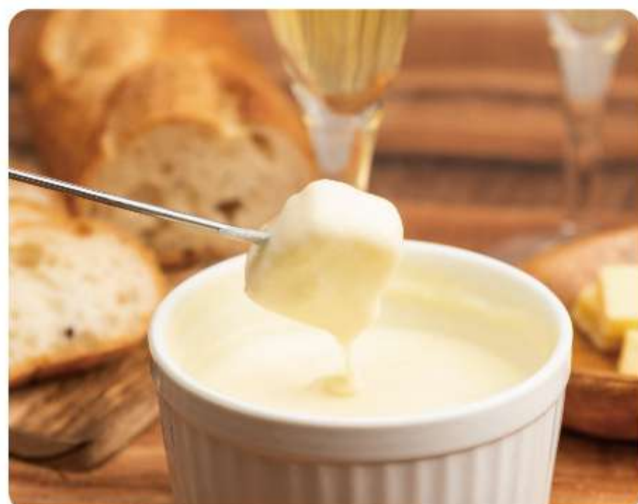
白居先生が教える簡単チーズフォンデュ教室。 チーズフォンデュ試食付です。

①10:30- (受付: 10:00-) ②14:00- (受付: 13:30-) ※当日受付・先着