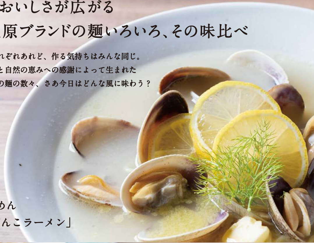
那須らーめん 「四代目がんこラーメン」