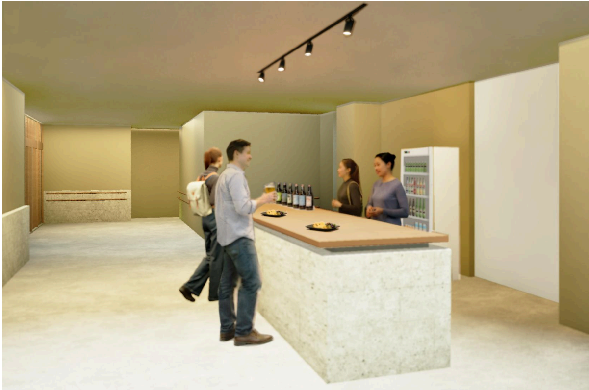
既存の給排水設備を活かしたバーカウンターエリア