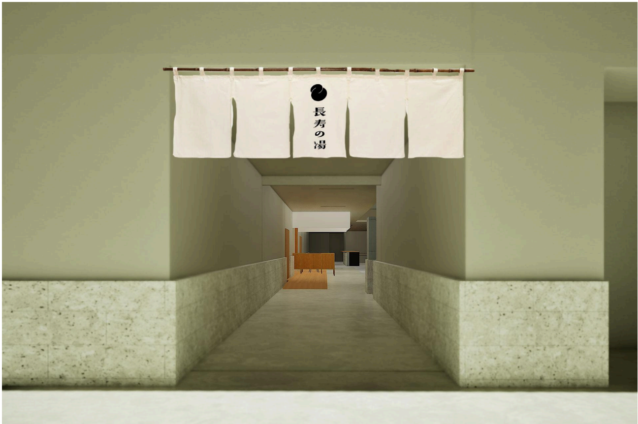
長寿の湯エリア入口イメージ

さまざまな過ごし方がゆるやかにつながり、人が自然と行き交う「まちの縁側」。この取り組みは、「長寿の湯」の記憶を引き継ぎながら、西那須野の日常に新たな魅力を生み出す、株式会社ゆつむぎが考えるこれからの地域にひらかれた銭湯のあり方の一つです。