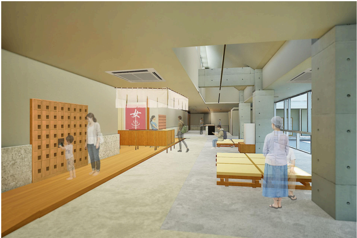
来館者が自由に行き交い、思い思いに滞在できるエントランス空間(まちの縁側)