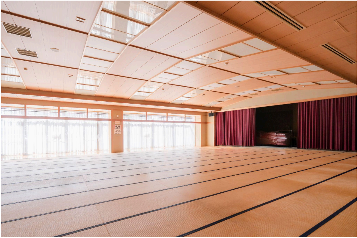
自然光が差し込み、開放感あふれる大広間の和室