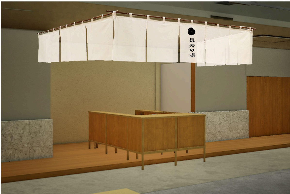
銭湯の象徴でもある番台を設置