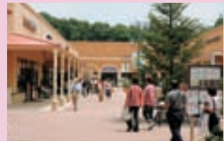
那須ガーデンアウトレット