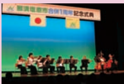
合併1周年記念式典