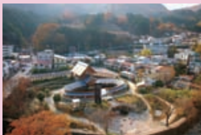
湯っ歩の里オープン