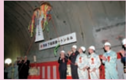
国道400号下塩原第1トンネル貫通式