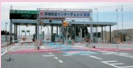
黒磯板室インターチェンジ開通