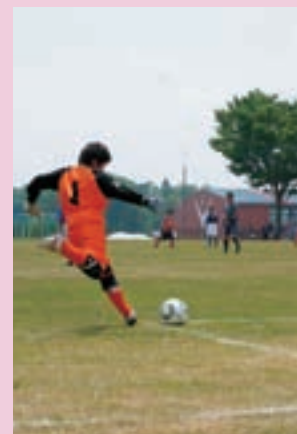
青木サッカー場オープン