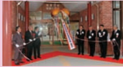
新しくなった塩原庁舎