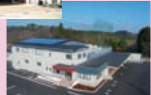
西那須野学校給食共同調理場