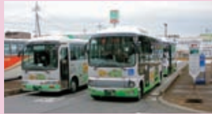
地域バス「ゆ〜バス」運行開始