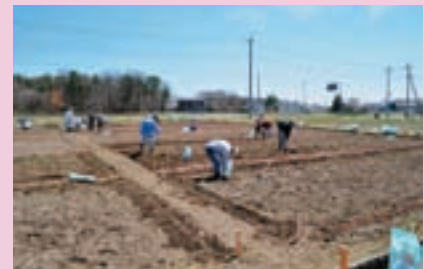
シルバーファーマー養成支援塾開講