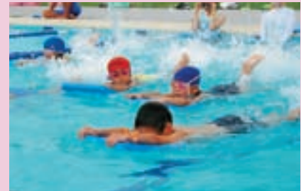
那珂川河畔公園プールリニューアルオープン