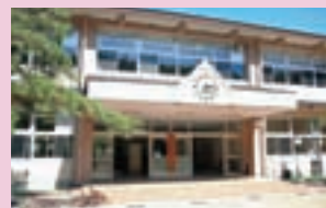
宿泊体験館 「メープル」