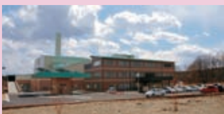
那須塩原クリーンセンター竣工