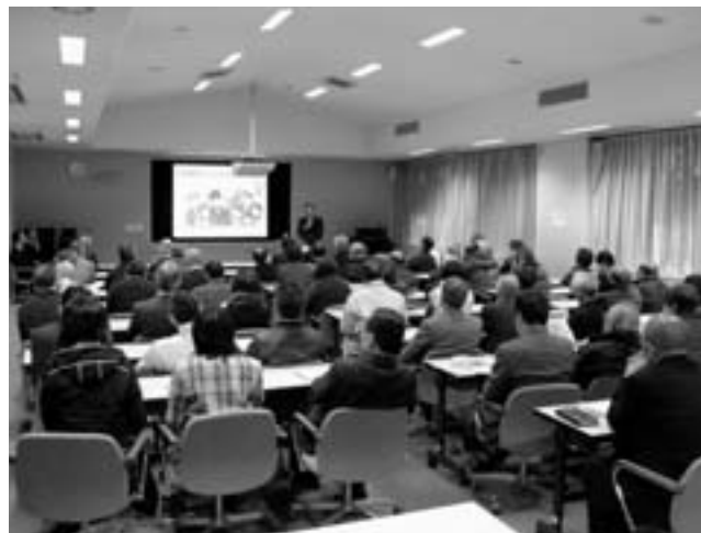
防犯講話に参加する地域防犯ボランティア