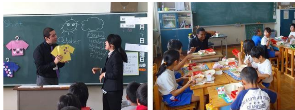
ALT（外国語指導助手）とのコミュニケーションで、英語力や国際感覚を養う