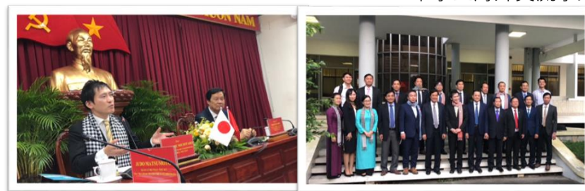
ベトナム・カントー市との相互連携協定