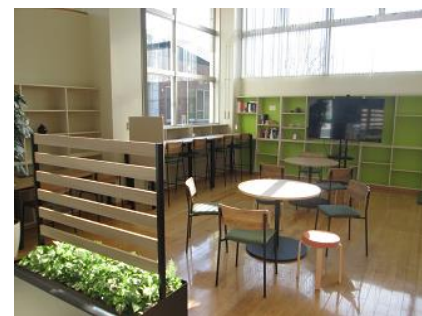
スマート公民館 シェアスペース