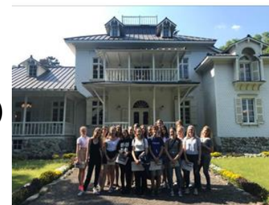
オーストリア・リンツ市 との中学生海外交流事業