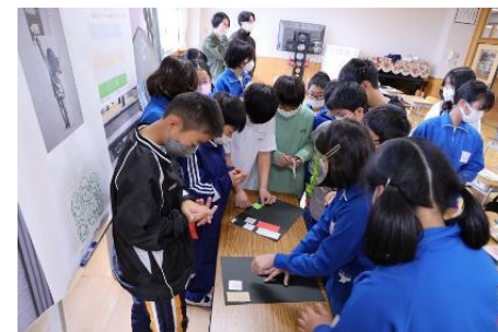
自発的な行動変容を促す「ナッジ」の手法を用いた実践型環境学習