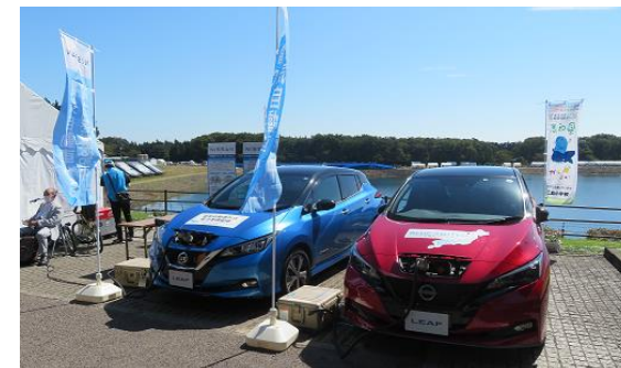
▼競技会場で使用する電力を市内の小水力発電で充電した電気自動車から供給