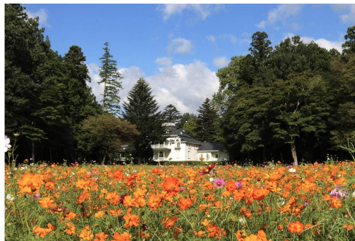
道の駅「明治の森・黒磯」 旧青木家那須別邸