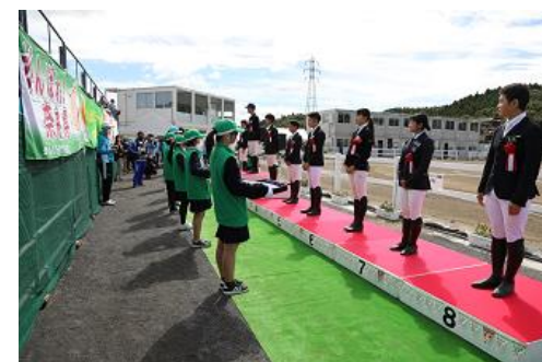
▲中高生を含めたボランティアの活躍