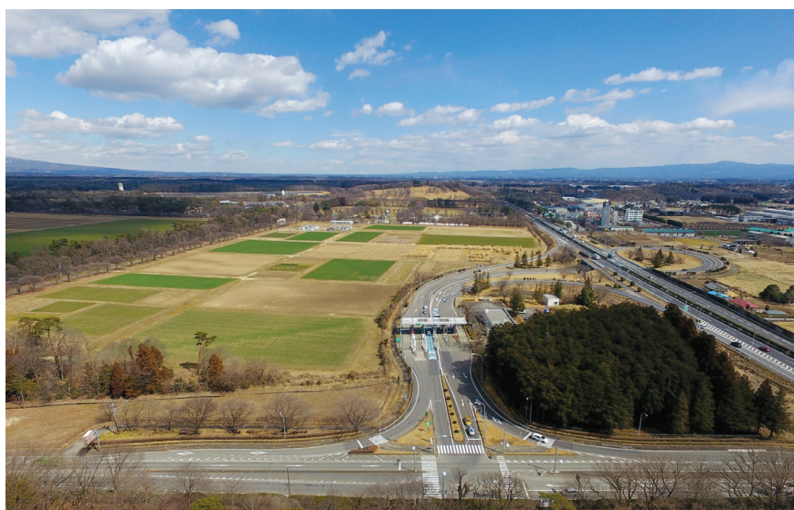
西那須野塩原インターチェンジ

地籍調査による土地境界の明確化は、土地利用の円滑化や事前防災や被災後の復旧・復興の迅速化などに寄与することから、計画的な実施を推進します。