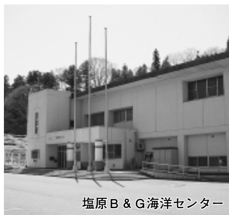
塩原B & G海洋センター