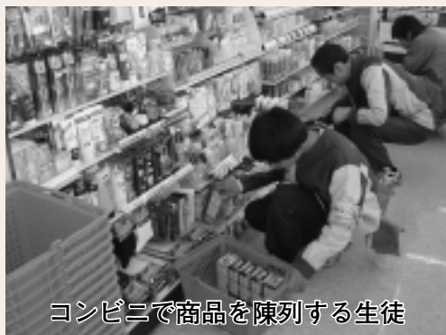
コンビニで商品を陳列する生徒