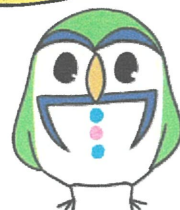
栃木県シルバー大学校 イメージキャラクター 「シルベス」