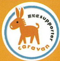
認知症サポーター キャラバン