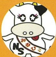
みるひい