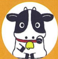
モースケ 黒磯駅前活性化委員会 マスコット