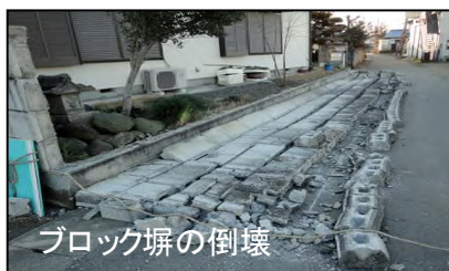
ブロック塀の倒壊