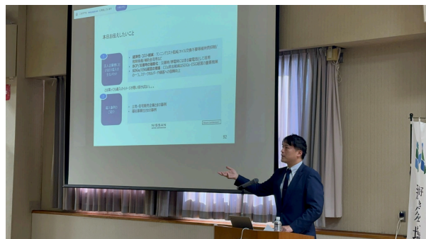
3-③ 日産自動車株式会社の講演