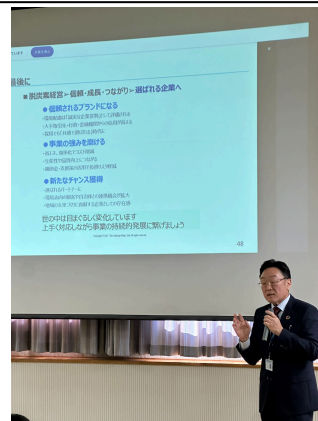
3-① 株式会社足利銀行の講演