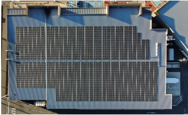
太陽光発電設備 (376kW、上空から撮影)