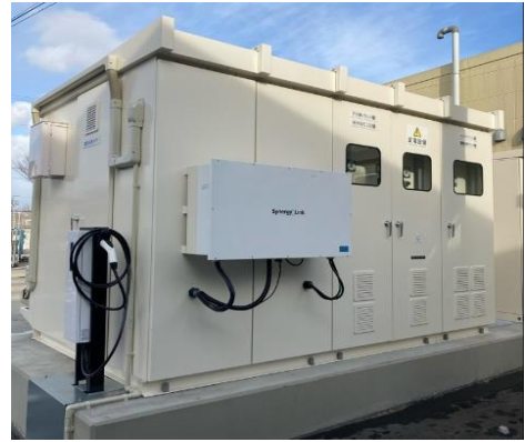
リチウムイオン蓄電池 (136kWh)