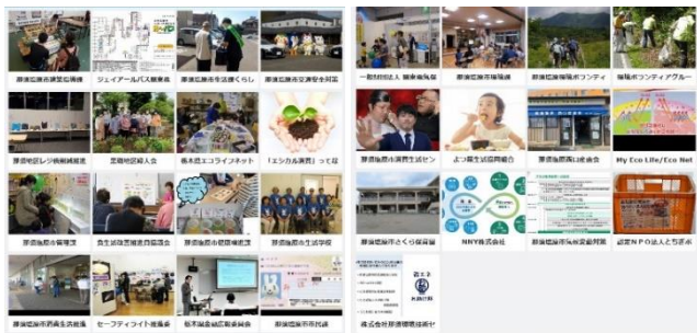
▲「デジタル」消費生活と環境展 特設ホームページ