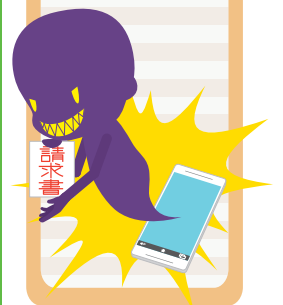
▲市内における架空請求ハガキの相談状況

不安になったらすぐに相談！ ★那須塩原市消費生活センター TEL 0287 (63) 7900 ★那須塩原警察署 TEL 0287 (67) 0110