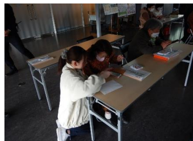
↑ スマホ講座の様子

デジタル化が進む現代において、スマートフォンによる個人情報の流出や詐欺被害を防ぎ、スマートフォンを安心安全に使うことができる講座となりました。