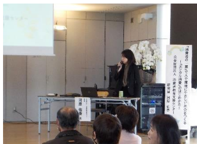
↑ エシカル消費講演会の様子

今年度は会場別にテーマを設定し、「くるる」会場では「賢い選択ができる消費者になろう!」、「みるる」会場では「さすてなぶる」ってなあに?」として、各出展団体様には、ご来場の方々へテーマに沿った啓発をしていただきました。