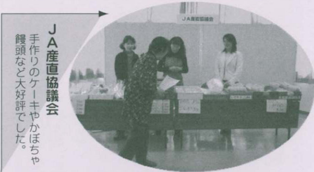
JA産直協議会 手作りのケーキやかぼちゃ 饅頭など大好評でした。