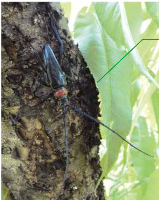
野外でのクビアカツヤカミキリ