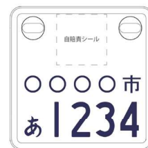
通常の原付よりも小型化！