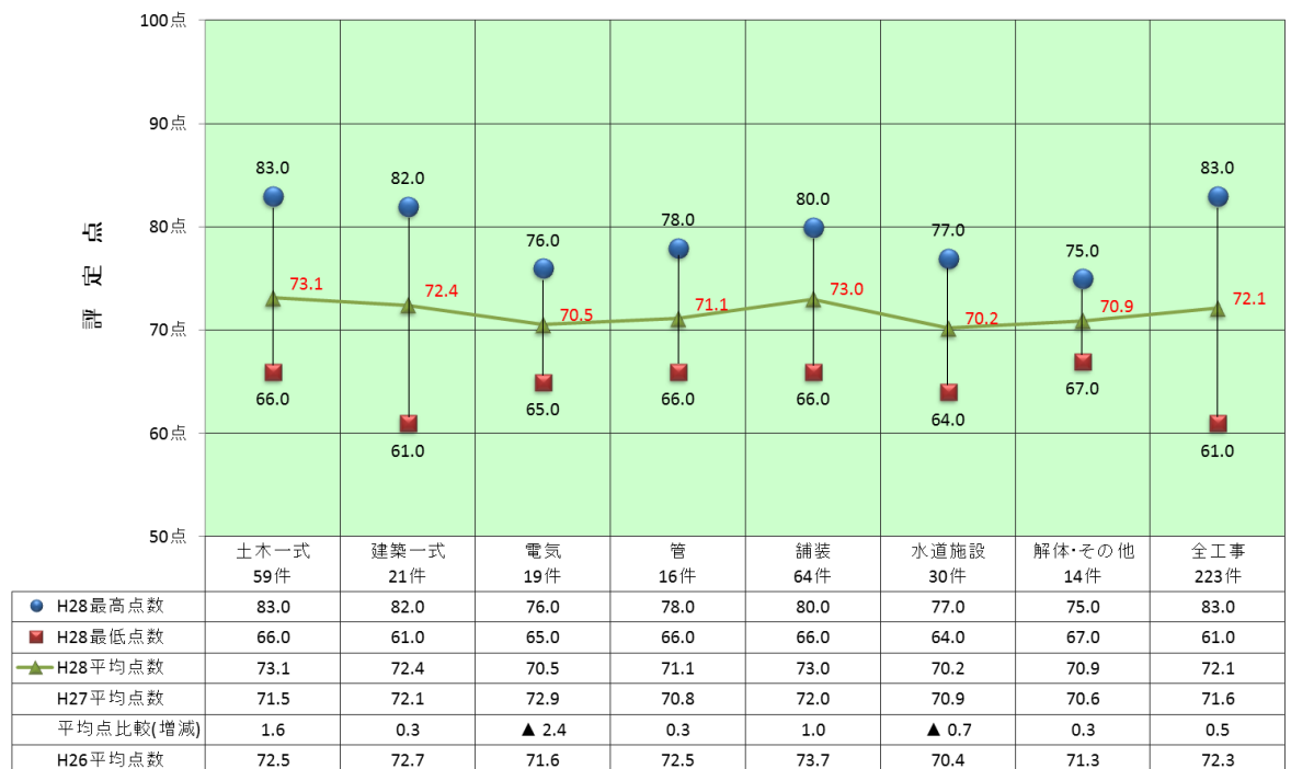
図 1. 工事成績評定結果（工種別）

前年度と比較すると、全体で 0.5 ポイント上昇し、工種別では、電気工事、水道施設工事は減少したが、それら以外の工種は上昇する結果となった。