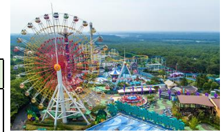
那須ハイランドパーク