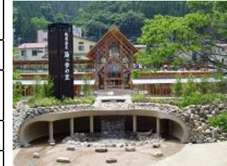
塩原温泉 湯っ歩の里