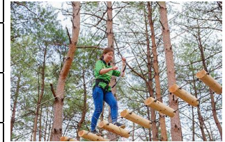
ホテルエピナール那須