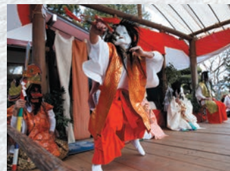
木綿畑新田太々神楽