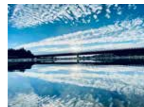
令和7年最優秀賞 「水鏡が魅せる世界線(蛇尾川)」