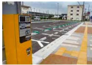
▲市営黒磯駅東口駐車場