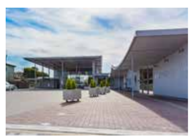
▲まちなか交流センター