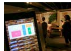
シミュレーションの様子

指紋・毛髪・足跡・血痕などの分析から、火災や交通事故の痕跡など、科学捜査(7種類9項目)を体験型展示で詳しく紹介!