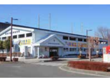
▲市営西那須野駅東口自転車駐車場