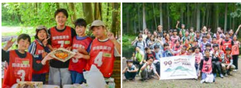
▲昨年度の様子(那須塩原市)