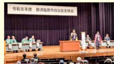
▲市長あいさつでも「1日じちレンジャー」の衣装を着用