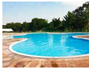
▲那珂川河畔公園プール