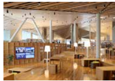
▲市図書館アクティブラーニングスペース