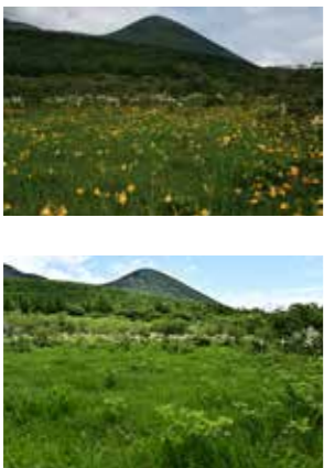
沼ッ原湿原のニッコウキスゲの発花。上:平成17年の様子。下:令和5年の様子。