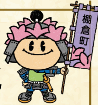
棚倉町のシンボルキャラクター 「たなちゃん」