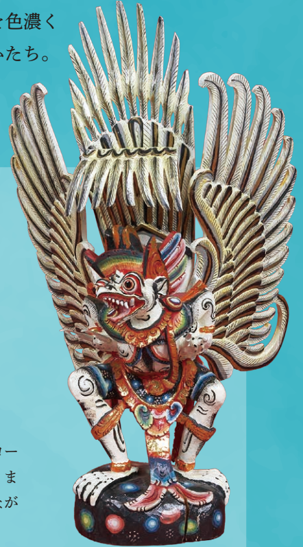
左：(左から) 毛糸人形 (ボルトガル)・インカの笛吹き男 (ペルー) 右：(上から) ガルーダ (インドネシア)・ダチョウ (アフリカ)

素朴な魅力があふれるアフリカや南米の人形、さらにヨーロッパやアジアの風俗や美意識を映し出す人形を巡ります。人形に込められた土地の記憶や人々の想いを感じながら、世界を旅するひとときをお楽しみください。