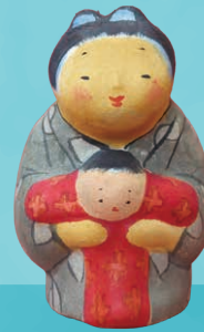
右：三四呂人形 子守複製 (静岡)

日本には、豊かな人形文化があります。南は沖縄県から北は北海道まで、地域ごとに受け継がれてきた人形には、暮らしの知恵や祈り、美意識が息づいています。人形を通して、日本各地の風土と心に触れる旅へとご案内します。