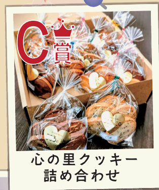
C賞 心の里クッキー 詰め合わせ