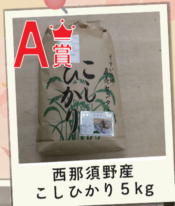
A賞 西那須野産 こしひかり 5kg