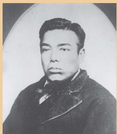
三島通庸 みしま みちつね

那須野が原にあった広大な原野は昔、水が乏しく荒涼たる大地でした。1885年（明治18年）、印南文作や矢板武を中心とする先覚者の努力により那須疏水が開削されたことで、急速に開墾が進み、多数の集落が形成されました。その礎となったのは、1880年（明治13年）三島通庸による「肇耕社（ちょうこうしゃ）」印南文作や矢板武による「那須開墾社」の開設にあるといえます。「なすの開墾まつり」は、明治18年4月15日に日本三大疏水の一つ「那須疏水」の開削起工式が行われたことを記念にしてはじめられた「開墾記念祭」が起源となる催しです。