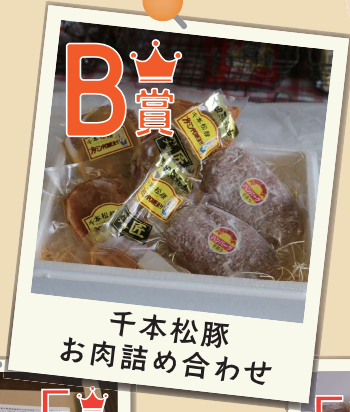
B賞 千本松豚 お肉詰め合わせ