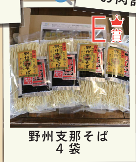
E賞 野州支那そば 4袋