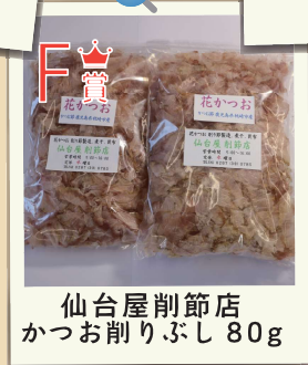
F賞 仙台屋削節店 かつお削りぶし 80g