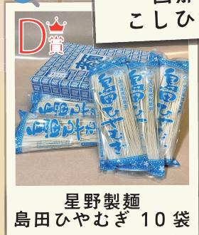
D賞 星野製麺 島田ひやむぎ 10袋