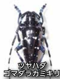
ツヤハダ ゴマダラカミキリ