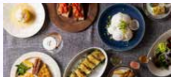
那須塩原ブランド認定品