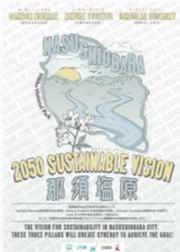
2050 Sustainable Vision 那須塩原