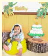
子育てイベントの作品