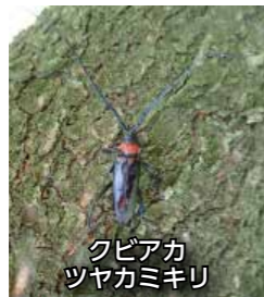
クビアカ ツヤカミキリ