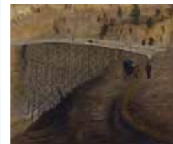
高橋由一 《鑿道八景(七景) 下野塩谷郡男鹿川独橋有三架》