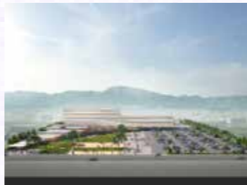
新庁舎完成イメージ