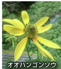
オオハンゴンソウ