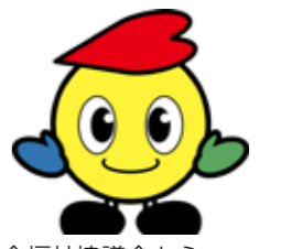
▲ 社会福祉協議会から「こころまる」も参加します！

長年にわたり社会福祉の発展に寄与した人たを顕彰する市社会福祉大会と、人権を考える人権フェスタを開催します。