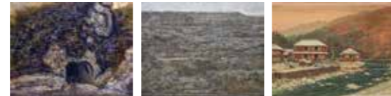
高橋由一《栗子山隧道図》 松本哲男《叢林》 五姓田義松《塩原風景》 那須野が原博物館蔵 日光市蔵 笠間日動美術館蔵