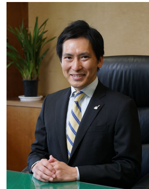
渡辺 美知太郎 市長