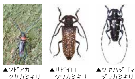
▲クビアカツヤカミキリ ▲サビイロクワカミキリ ▲ツヤハダゴダラカミキリ