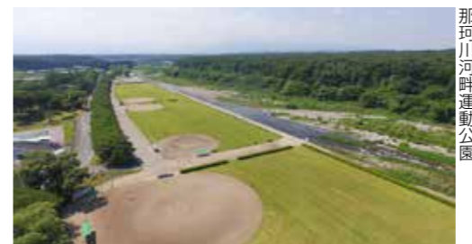
那珂川河畔運動公園