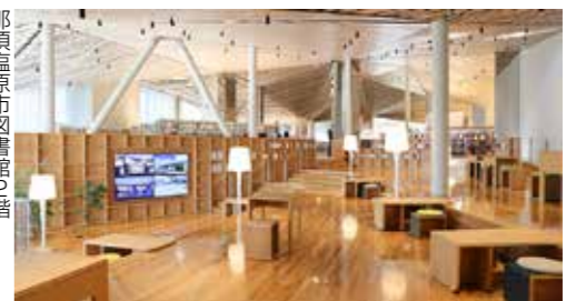
那須塩原市図書館2階アクティブライニングスペース