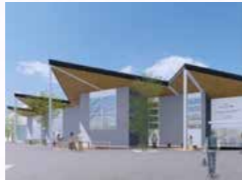
道の駅「明治の森・黒磯」完成イメージ