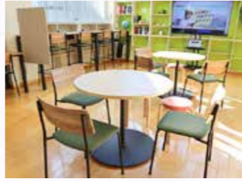
公民館のシェアスペース