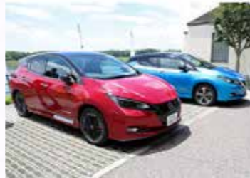
電気自動車などの購入費補助