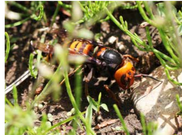
地表を歩くオオスズメバチの女王バチ 撮影日：2011.5.9 撮影場所：千本松

春に野山を歩いていると、ひときわ大きなハチに出会うことがあります。それはスズメバチの女王バチ。最も大きなオオスズメバチの女王は体長が4～4.5センチメートルもあり、大人の親指ほどの大きさになります。