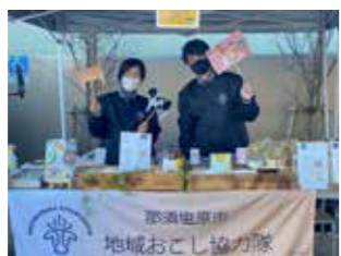
イベントでの協力隊ブースで「那須塩原市」の牛乳&チーズをPRしました!

情報発信を主な活動内容としている自分は、SNSでの発信や他市町の協力隊との共同活動、各種イベントでのブース出店など日頃から楽しく活動しています。現在は市内の高校生と一緒に那須塩原市を盛り上げていく活動を企画中です。ぜひ地域おこし協力隊のInstagramをチェックしてください!