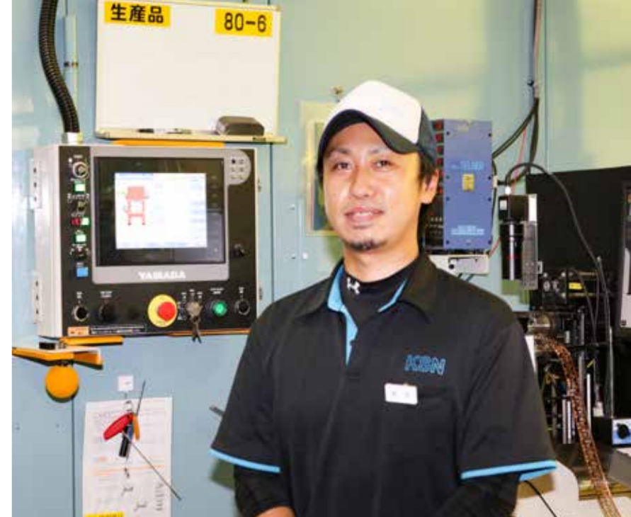
星 学さん 入社17年目 製造グループ 第1製造課高速ライン