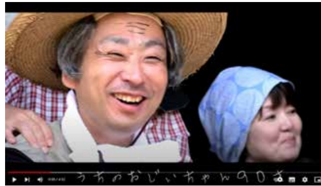
身近に在宅医療や介護を必要としている人はいませんか