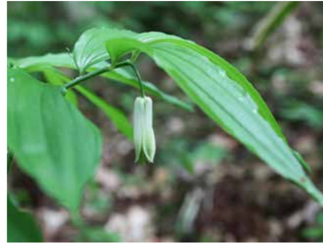
ホウチャクソウ 撮影日：2019.5.18 撮影場所：木の俣園地

今回紹介するのは、5月下旬に咲く花ホウチャクソウです。木の俣園地などに行くと、緑色の葉の中に全体が白くて先が緑色の花が見つかります。