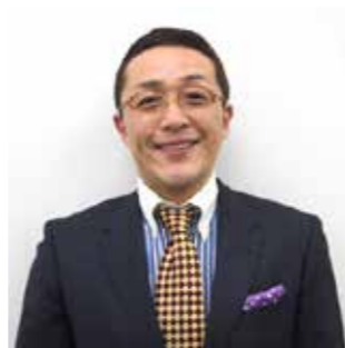
スマイリーキクチ氏