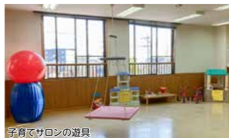
子育てサロンの遊具