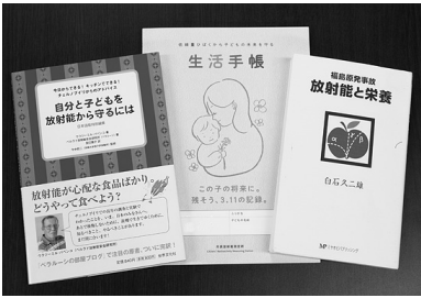
キッチンから放射性物質の除去ができる方法が書かれた本もあり、参考になります

(http://nasu-toride.org/) 測定に加わった際、お米や野菜の農家の皆さんが現状を見つめ次なる方法を探す姿に心打たれました。 原発事故により、那須塩原市には放射線量が高いホットスポットと言われる場所ができてしまいました。 この状況に対し、生活環境などの違いでいろいろな意見や考え方がありますが、それぞれの意見を尊重し、何が本当に必要なことなのかを考え、これからは放射能対策を続け、「いのち」が真ん中にある温かい社会を作っていきたいと思っています。