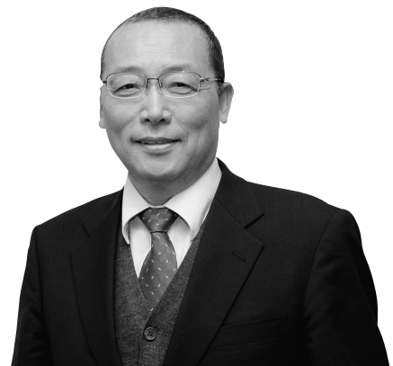
那須塩原市長職務代理者 那須塩原市副市長 松下 昇