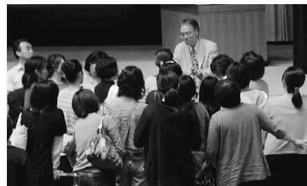
約700人集まった白石氏の講演会。終了後には多くのお母さんたちが質問をしていました

2011年3月11日は、皆さんにとっても忘れられない日だと思えます。東京電力福島第一原発事故当初、初めて聞く「シーベルト」や「ベクレル」などの言葉に頭の中はチンプンカンプン。おまけに放射線は匂いもなければ見ること出来ません。私はとても不安になり、とにかく勉強しようとして各種講演会に参加し、今は主的に被ばくを防ぐためにさまざまな活動に参加しています。正確に放射能について知ると具体的な対策方法がわかり、行動することで「安