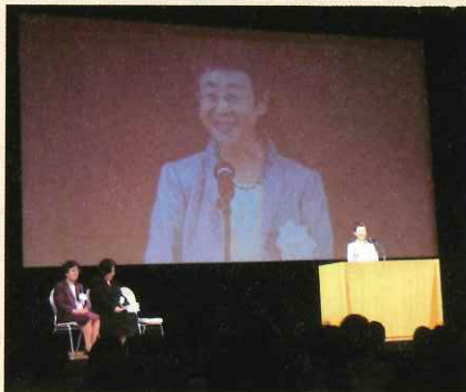
開会宣言をする仙台市長

会場に入る前、石巻市で震災の跡地を見た時、胸が押しつぶされそうなくらい、辛い悲しさが押し寄せてきました。シンポジウムは復興をどのようにするのか、それぞれの「これまでと今と」について、コーディネーター、パネリスト5人の誰もが被災地体験を語り、お互いの体験や思いを共有し地域に持ち帰り、語り継いでほしいと強く願っておられました。