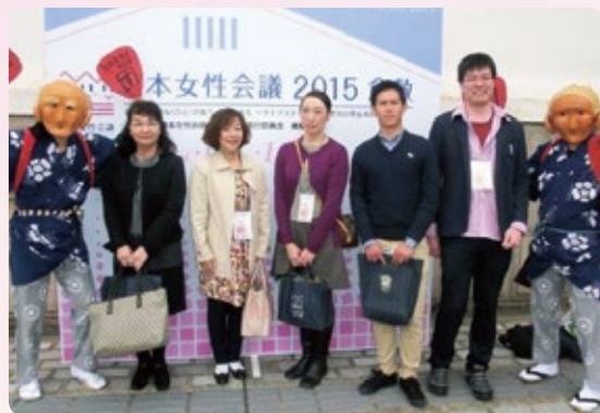
日本女性会議会場にて