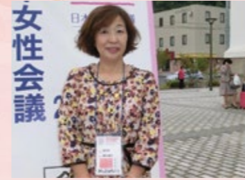
日本女性会議会場にて