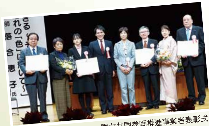
男女共同参画推進事業者表彰式