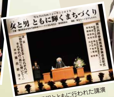
手話通訳とともに行われた講演