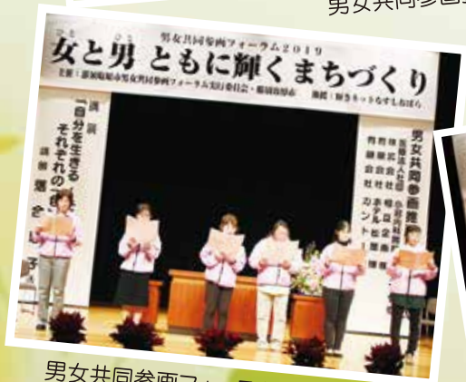
男女共同参画フォーラム実行委員会 による市の歌斉唱