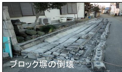
ブロック塀の倒壊